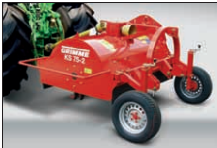
Rask omstilling: Rask og enkel omstilling mellom front- og bakmontering.