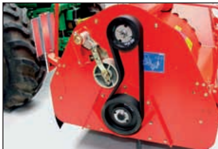
Enkelt og nøyaktig: Automatisk kilereimsstramming (KS 75-2, KSA 75-2 og KS 75-4)