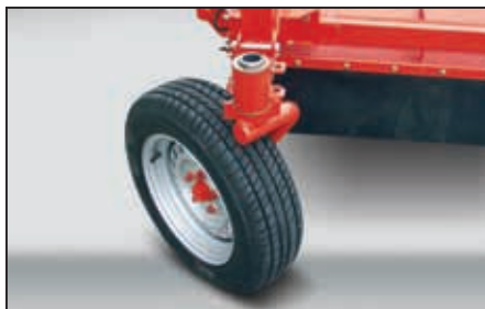
... pendelopphengte dybdehjul som ekstrautstyr.