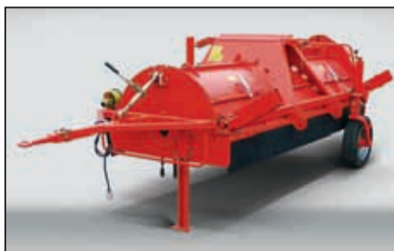
Enkel transport med store maskiner: transporthjul og drag.