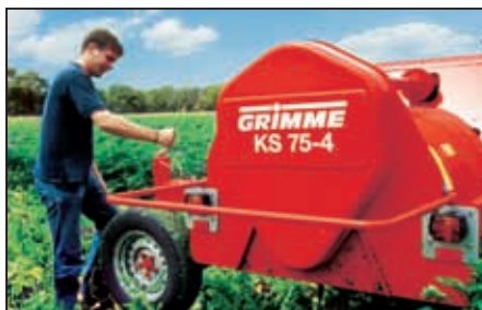
Nøyaktig arbeidsdybde: Dybdehjul eller ...