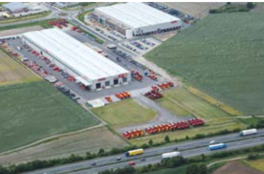
المصنع الثاني، 12 كم من المقر الرئيسي Niedersachsenpark