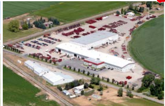
SPUDNIK في الولايات المتحدة الأمريكية