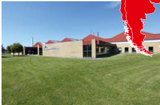
ASA-LIFT في الدنمارك