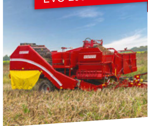
Im Einsatz: Feldverladestation